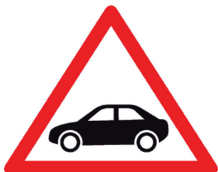
Conducción: ver prospecto

Busque en el cartonaje de los medicamentos que esté tomando si aparece el siguiente símbolo de advertencia: