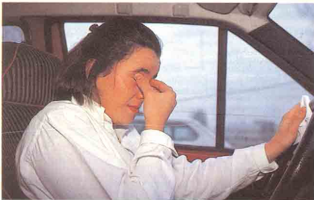
PELIGROSO El lagrimeo, la conjuntivitis, la fotofobia... Un panorama desolador para la conducción.

gias se confundían frecuentemente con resfriados, debido a que los síntomas son similares. Y, de hecho, podrían ingerirse fármacos antigripales (muchos contienen antihistamínicos y son, por ello, peligrosos para conducir) para combatirlos, aunque sólo reducirían la sintomatología, sin acabar con la alergia.