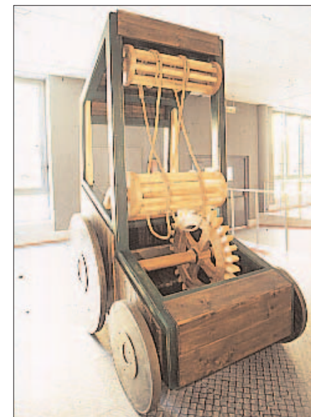
AELOPIRO. Un antecedente del automóvil.