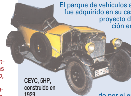
CEYC, 5HP, construido en 1929.

El parque de vehículos antiguos de la Dirección General de Tráfico (DGT) fue adquirido en su casi totalidad entre 1987 y 1988, cuando existía el proyecto de la creación de un Museo Nacional de Automoción en Tejares (Salamanca). En total son 47 vehículos —de los que 44 se han cedido al museo— que pertenecieron, en su gran mayoría, al antiguo Parque Móvil Ministerial (PMM).