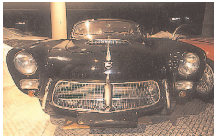
PEGASO. El Pegaso deportivo "Z-102" carrozado por Saoutchik.

que cuenta con una biblioteca informatizada, una hemeroteca, una videoteca y una tienda de recuerdos. El archivo y la base de datos sobre el automóvil en España cuenta con casi 10.000 volúmenes de libros, catá-