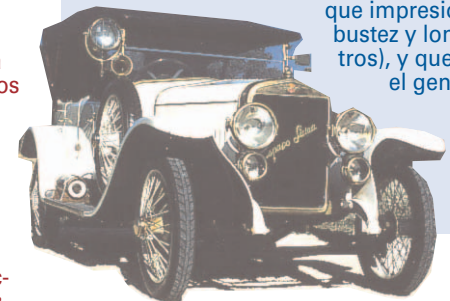
Hispano-Suiza, 6 cilindros, 22HP, construido en 1939.

Destaca también un Hispano Suiza de 1910, matrícula GR 60, que es el mayor exponente de la industria automovilística española y que se encuentra en estado original. Dada su importancia se consiguió que el Ministerio de Cultura, por primera vez, declarara no exportable un automóvil.