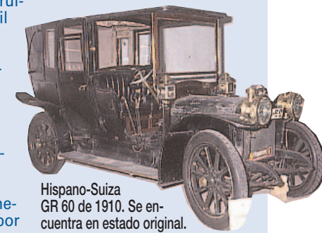
Hispano-Suiza GR 60 de 1910. Se encuentra en estado original.

En el museo se encuentra también un Cadillac "Fleetwood 75 Limousine", de 1970, que impresiona por su robustez y longitud (6,193 metros), y que fue utilizado por el general Franco en su última época. El interés histórico radica en que en su amplio y lujoso recinto interior, con capacidad para ocho plazas, el ex-jefe de Estado solía despachar mientras era conducido desde El Pardo a su despacho oficial.