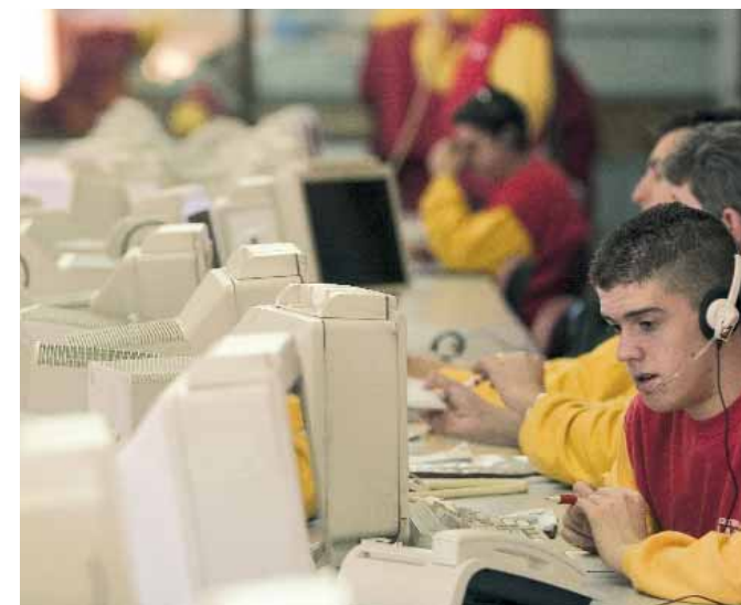
► En los nuevos desguaces nos podemos encontrar con imágenes como estas: todo un despliegue de nuevas tecnologías al servicio del usuario.