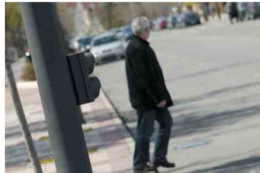
► Cruzar fuera de los pasos para peatones incrementa el riesgo de atropello notablemente.

mativa española una distancia de visibilidad para los usuarios de los pasos (vehículos y peatones), lo que "impide a los conductores ver a los peatones a tiempo de frenar"; tampoco existe una distancia entre pasos, lo que "provoca que los peatones crucen fuera del paso para peatones", multiplicando por nueve el riesgo de atropello; tampoco aparecen recomendaciones sobre el uso de material reflectante para las rayas de los pasos ni de material antideslizante, lo que según el RACC, "empeora la calidad del paso de peatones y puede pasar inadver-