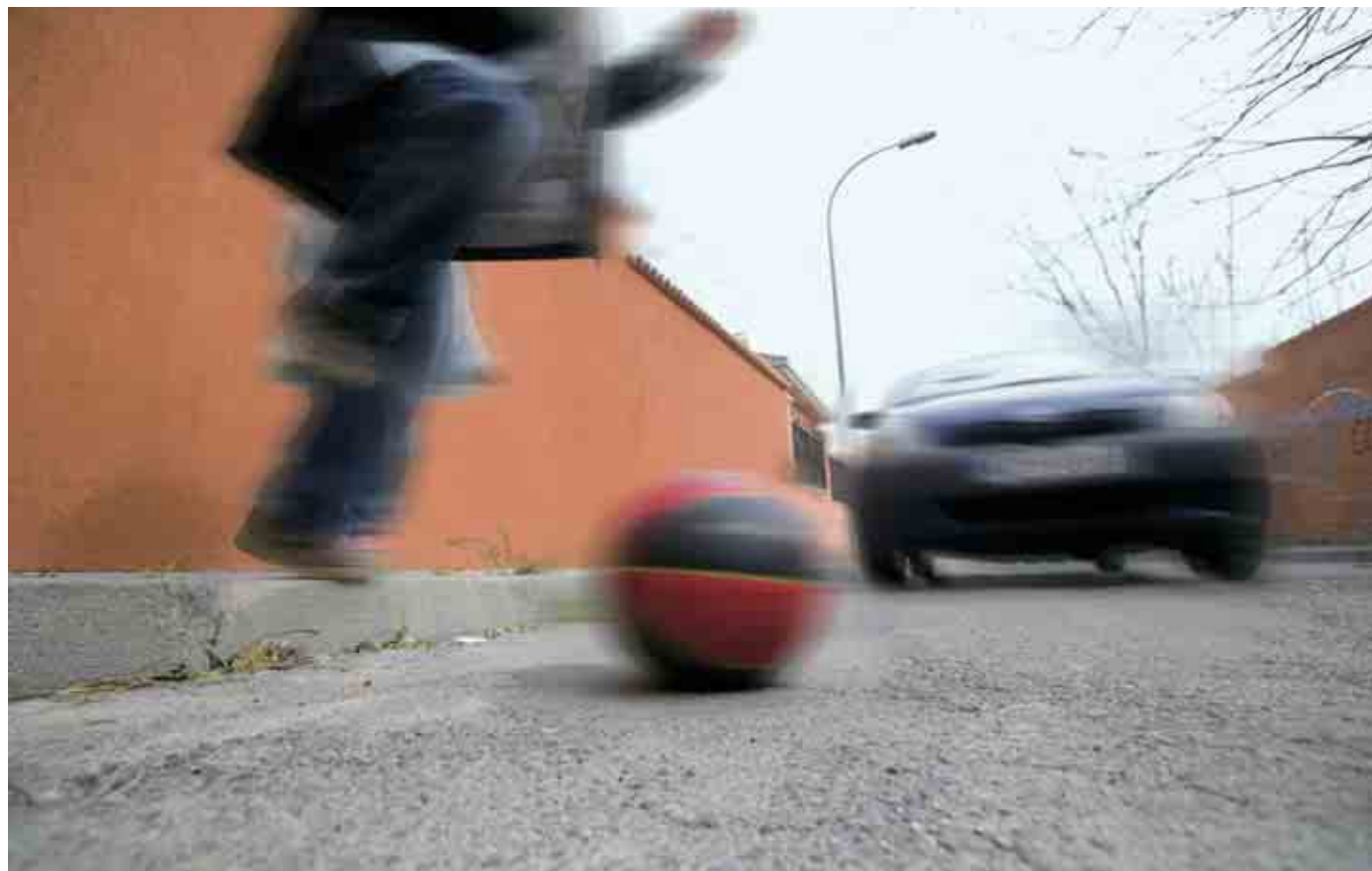
► Irrumpir sorpresivamente en la calzada da lugar a muchos accidentes, en especial entre los niños.

miendan "cruzar las calles únicamente sobre pasos de peatones".