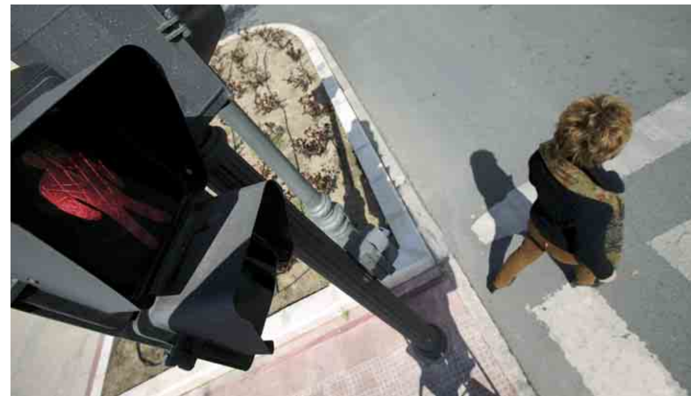
► No respetar la señal de semáforo es una de las principales infracciones de los peatones en ciudad.

es el país con la peor tasa de víctimas mortales peatonales por habitante (15,7/millón), tanto dentro como fuera de pasos para peatones, con un total de 680 viandantes muertos en 2005, año al que se refieren todos los datos del estudio. Mientras tanto, países similares al nuestro por número de habitantes y potencia económica, como Italia e Inglaterra, se quedan en una tasa de 11,5/millón de habitantes, y los países mejor situados (Holanda, 4,6; Noruega, 6,7; y Finlandia, 7,2) quedan envidiablemente lejos.