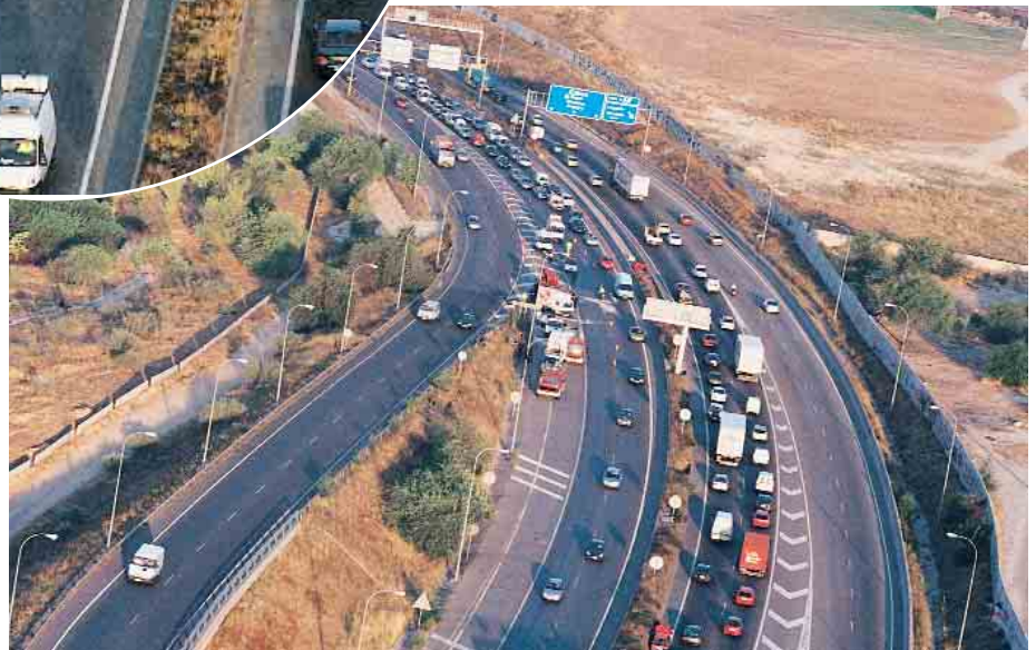
...BASTANTE retención en la calzada contraria, sin duda debido al efecto de los ‘mirones’.