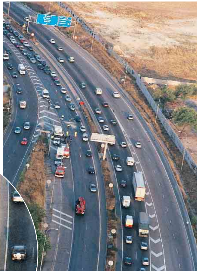
REPETICIÓN. Otro accidente en que se puede argumentar lo mismo: atasco en la calzada donde se ha producido el accidente y...