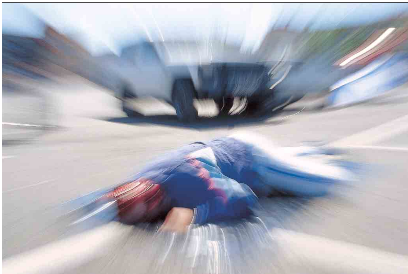
► El baremo que puntúa las secuelas por accidentes de tráfico se ha adaptado a la normativa europea.

La ley de Responsabilidad Civil y Seguro en la Circulación de Vehículos a Motor acaba de sufrir una modificación parcial en el baremo que fija las indemnizaciones por las lesiones por accidentes de tráfico. Así, las más frecuentes recibirán una indemnización menor, mientras las menos comunes, aunque más graves, cobrarán más. Esta es la valoración de la mayoría de los especialistas y entidades consultadas por "Tráfico", aunque unos ponen el acento en lo económico, y otras en lo médico.