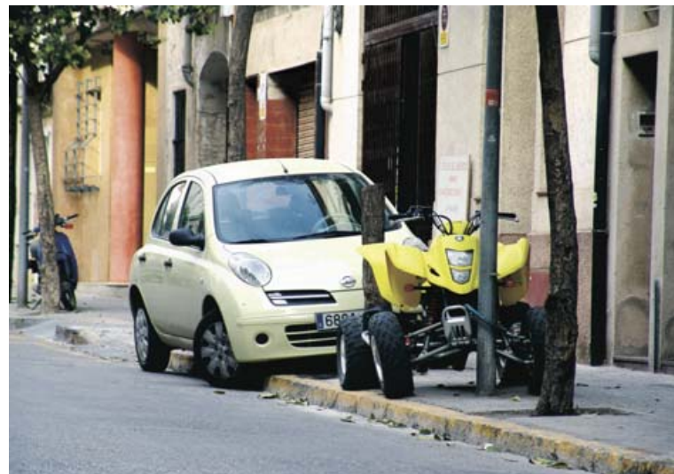
► Los conductores antisociales suelen acumular multas por aparcamiento indebido, son infractores reincidentes.