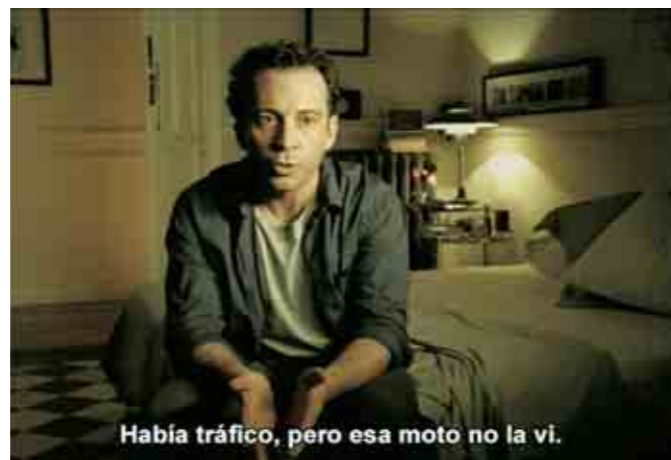
► La imagen corresponde a uno de los dos anuncios que se han podido ver en televisión dentro de la campaña contra los accidentes de moto. Por primera vez, el conductor de un automóvil reflexiona sobre el accidente que podía haber evitado si hubiera mirado bien por el retrovisor. Arriba, secuencia del anuncio.

Los anuncios son representativos de dos de las situaciones más comunes en