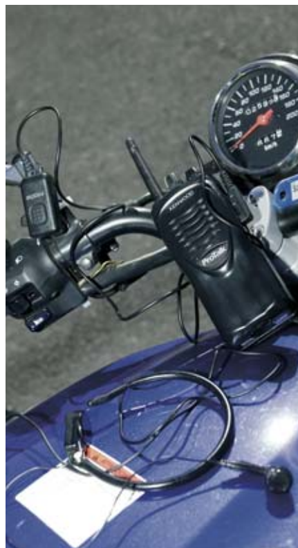
► El motorista que se examina lleva un auricular a través del que recibe las instrucciones.

TAMBIÉN EN CARRETERA. La prueba de circulación se realiza tras superar el examen teórico y el de destreza. Para prepararla, el alumno recibe una licencia de aprendizaje, válida durante 6 meses, que le permite realizar prácticas en una escuela de formación. Una vez en el examen, el aspirante conduce la moto en solitario, seguida por el vehículo del profesor y el examinador, que dan instrucciones al alumno a través de un interco-