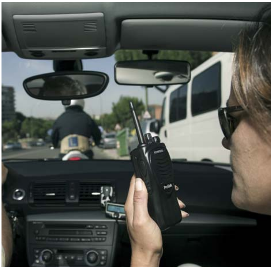
➤ En la prueba de circulación, el examinador da las instrucciones a través de un intercomunicador.

ciones en toda España". Los exámenes para los permisos de moto incluyen, además, la prueba de destreza que se lleva a cabo en circuito cerrado y que ha cambiado para adecuarse a la normativa comunitaria.