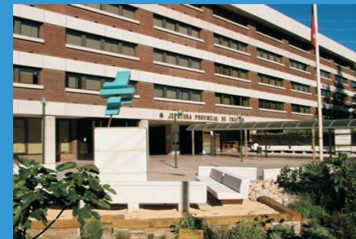
Jefatura Provincial de Tráfico de Madrid