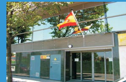
Oficina Local de Tráfico de Alcorcón