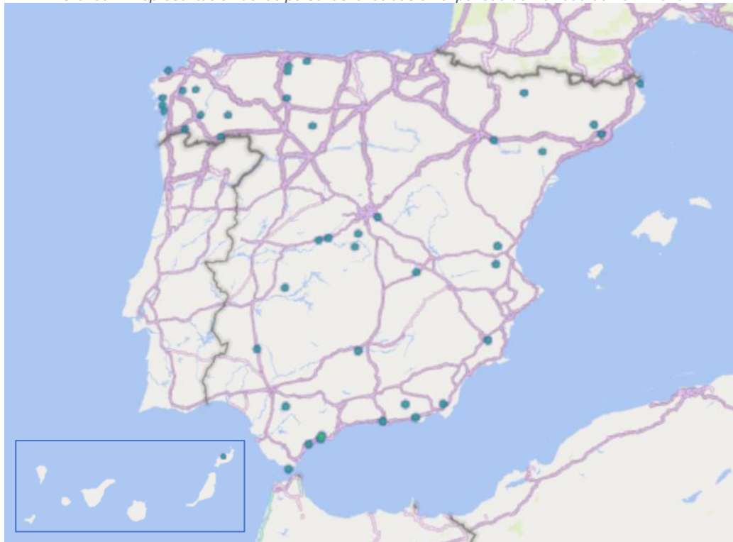
Gráfico 2: Representación de las personas fallecidas en el periodo de Navidad de 2024/2025