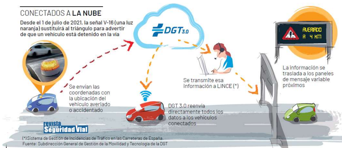
Ilustración 2. Esquema de funcionamiento de la señal V-16.

La señal V-16, que se deberá llevar en la guantera de todos los vehículos, cuando sea activada por el usuario en caso de avería o accidente, aparte de emitir la luz de advertencia, se conectará a DGT 3.0 para transmitir su ubicación en tiempo real. La plataforma DGT 3.0, a la recepción de la información suministrada, contrastará los datos sobre el incidente con los Sistemas de Gestión de Tráfico (equipamiento en carretera, información de agentes en carretera, etc.) y con otras fuentes de información, para garantizar su veracidad. En caso de que se confirme el incidente, éste se almacenará en el sistema como activo y se publicará para poder alertar a los usuarios que circulen en la proximidad del mismo.