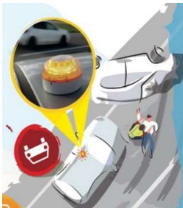
Ilustración 1. Señal V-16. Fuente: DGT

La nueva señal V-16 es un dispositivo luminoso intermitente de color naranja que sustituye a los triángulos como método para señalar un vehículo detenido en la vía. Debe ser colocado en la parte más alta posible del vehículo cuando este quede inmovilizado en la vía para garantizar la máxima visibilidad del mismo y deberá comunicar con la plataforma DGT 3.0 su geolocalización, para poder alertar al resto conductores que se acercan a ese punto de la carretera.