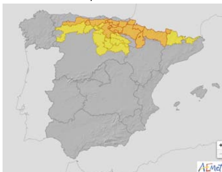
Viernes, 1 de abril