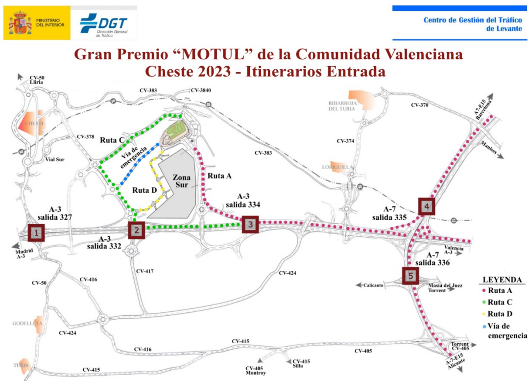
Fig.1: Itinerarios de Acceso al Circuito