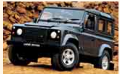
LAND ROVER "DEFENDER"

AUTOVAZ, CATERHAM, DAEWOO "MATIZ S", DAEWOO "LANOS 1.4I 3P", GALLOPER "SUPER EXCED 2.5 tdi CONFORT", LAND ROVER "DEFENDER", LOTUS "ELISE", MITSUBISHI "L 2004X2", MORGAN, SSANG YONG "KORANDO" Y "MUSSO", SUZUKI "SAMURAI" Y "VITARA", toda la gama TATA Y TOYOTA "HILUX BASE".