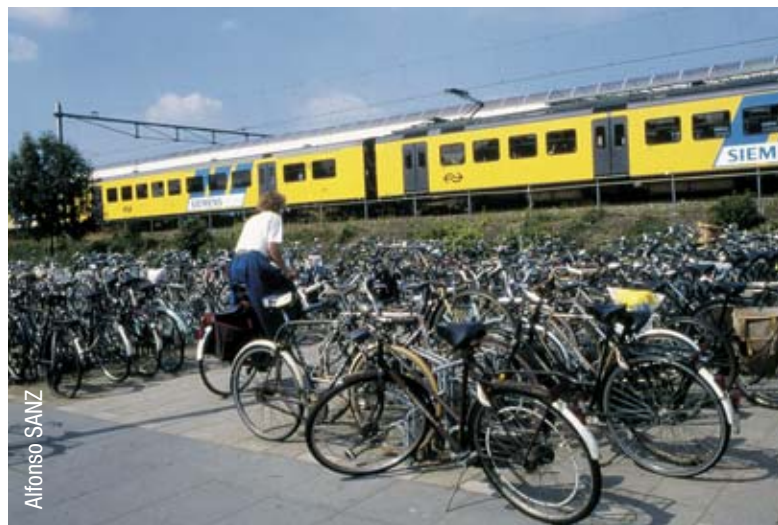
➤ Grandes aparcamientos para bici junto al transporte público son fundamentales.

ciudades de Europa y España, pero ayudaría mucho si las administraciones acometieran planes integrales de movilidad sostenible, donde peatón, ciclista y usuario del transporte público colectivo, por ese orden, fueran actores principales. Otros modos, al despilfarrar recursos y contaminar más, serían secundarios”.