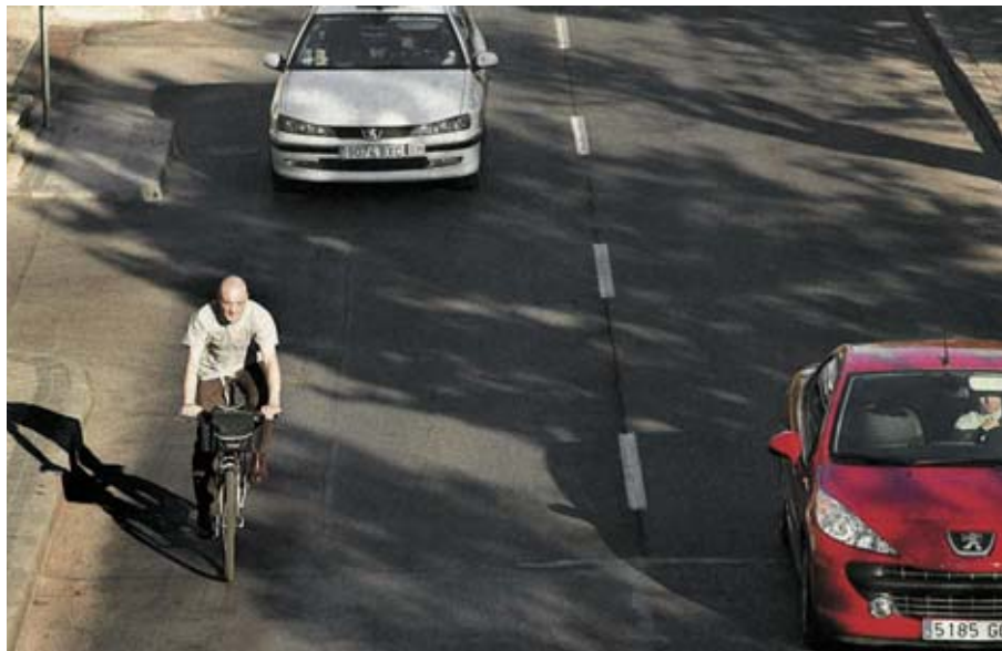
► Los chaparrones y el sol 'de justicia' son los únicos inconvenientes para el uso de la bici, según la UE.